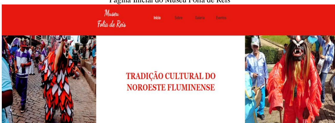
Página Inicial do Museu Folia de Reis