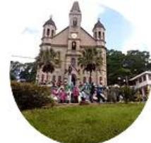
Festa de Arremate